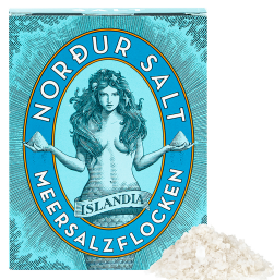
Abbildung / Picture